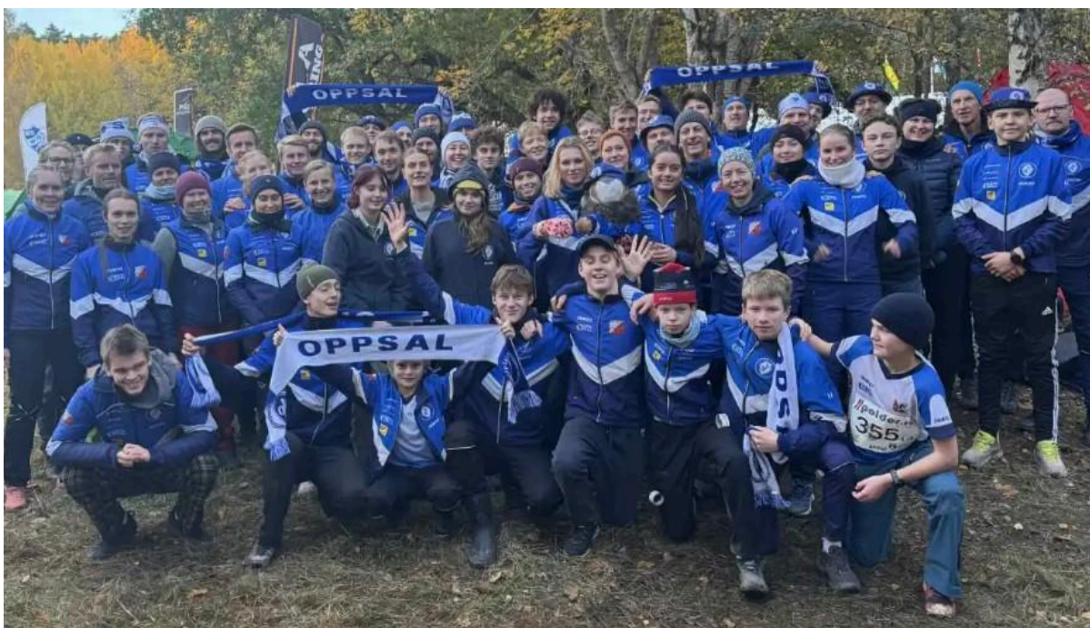
25-mannatropen som dro til Stockholm i oktober - årets beste klubbturn?

Klubben arbeider etter norsk idretts felles visjon om idretts glede for alle. For barn og unge har økonomi som barriere vært et viktig fokusområde i norsk idrett. Klubben ønsker å holde treningsavgifter og egenandeler på et lavt nivå, og at utstyr skal være tilgjengelig for en rimelig penge. Klubbens ryggrad, barne- og ungdomsarbeid krever mye, og det er viktig at vi bruker nok ressurser for at dette arbeidet skal fungere godt videre.