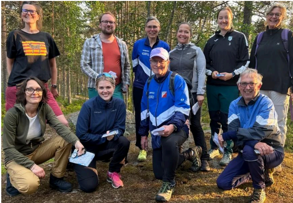
Kursdeltagere og kursholdere på nybegynnerkurs for voksne i Ola Dilt-regi

«Ola Dilt-dagene» (med ekstra poster) ble avholdt fra 25.august og ut sesongen på Skullerudåsen.