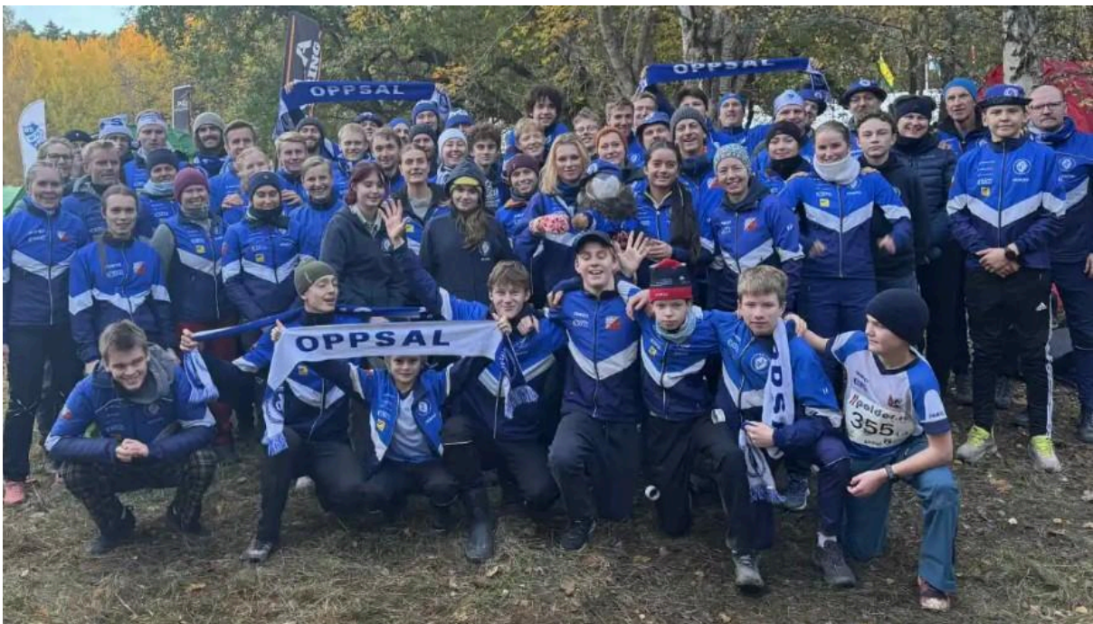
25-mannatropen som dro til Stockholm i oktober - årets beste klubbturné?

Klubben arbeider etter norsk idretts felles visjon om idretts glede for alle. For barn og unge har økonomi som barriere vært et viktig fokusområde i norsk idrett. Klubben ønsker å holde treningsavgifter og egenandeler på et lavt nivå, og at utstyr skal være tilgjengelig for en rimelig penge. Klubbens ryggrad, barne- og ungdomsarbeid krever mye, og det er viktig at vi bruker nok ressurser for at dette arbeidet skal fungere godt videre.