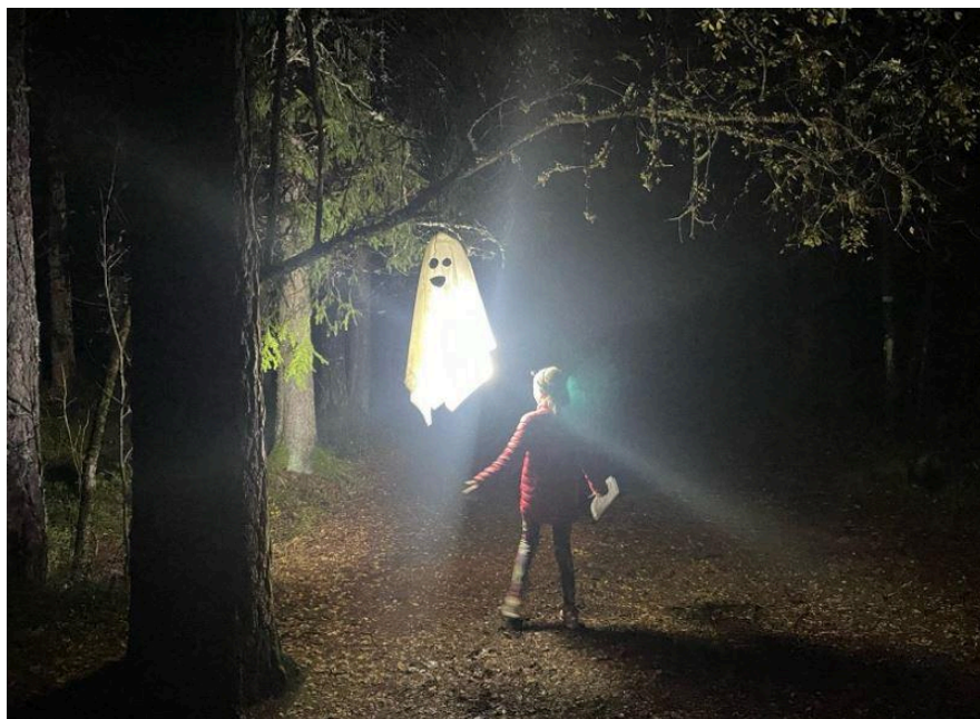
Skumleløpet - arrangert av ungdomsgruppa, populært blant råtassene

Allikevel har 2024 vært et veldig bra år for råtassene med masse positive opplevelser og mestringsfølelser for mange flinke og ivrige barn - som til sammen har løpt 911 løyper på treningene våre.