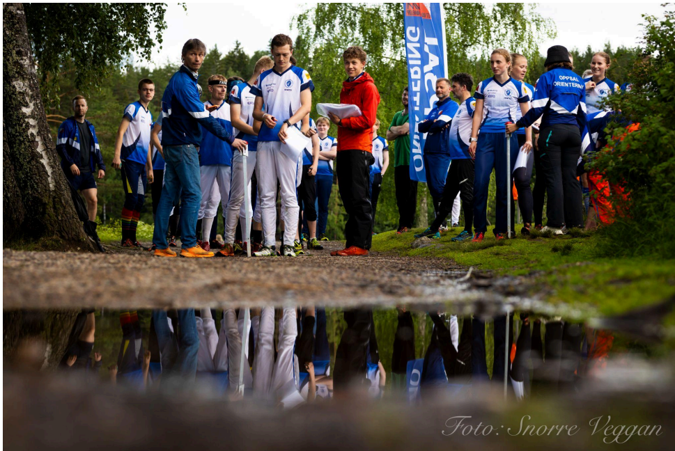
Midtsommerklassikeren på Bråten!