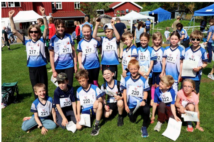
Oppsal-lagene i Råtasskonkurransen på Sandbakken

Oppsals råtasser startet 2024 sesongen den 7. mai på Haraløkka med mange nye rekrutter og gledelig nok mange der familien ikke tidligere har drevet med orientering. Tilstrømmingen fortsatte gjennom sesongen og totalt har vi hatt 46 forskjellige barn med på treningene med et gjennomsnitt på 30 stykker på hver. Råtasstreningene våre ble arrangert hver tirsdag helt frem til den åttende oktober.