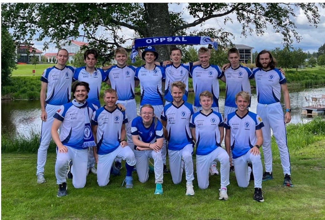
Herrelagene på precamp før Jukola

En barriere ble brutt med klubbrekorden i 25-manna. 25.plass og premie i denne stafetten for første gang var en fantastisk avslutning på stafettsesongen - og det er selvsagt ekstra gledelig at det skjer på klubbtur i en stafett hvor løpere i alle aldre må bidra til sluttresultatet.