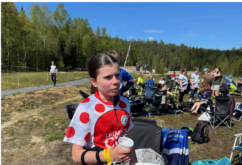
Ane med klatretrøya i en av årets Trimtex Cup-runder