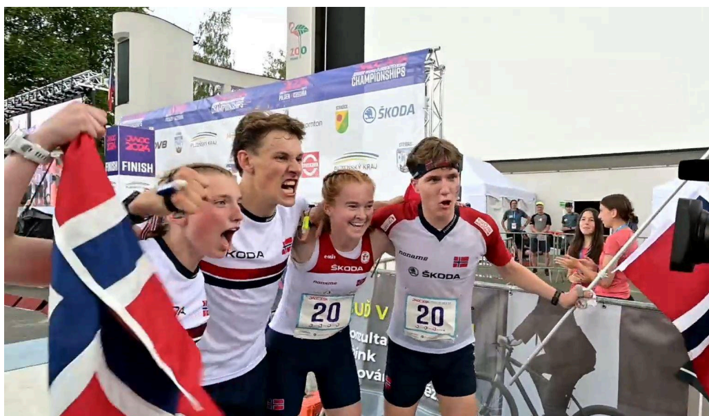
Ingeborg og Norge slipper jubelen løs etter gull på sprintstafetten!

*lagene fikk ikke plassering i VM, da landet hadde lag høyere opp på lista