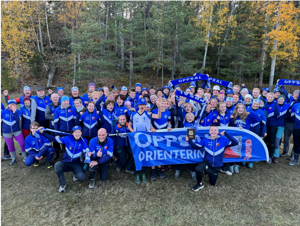
Oppsal-gjengen etter et av årets virkelige høydepunkter: 25.plass og klubbrekord på 25-manna!