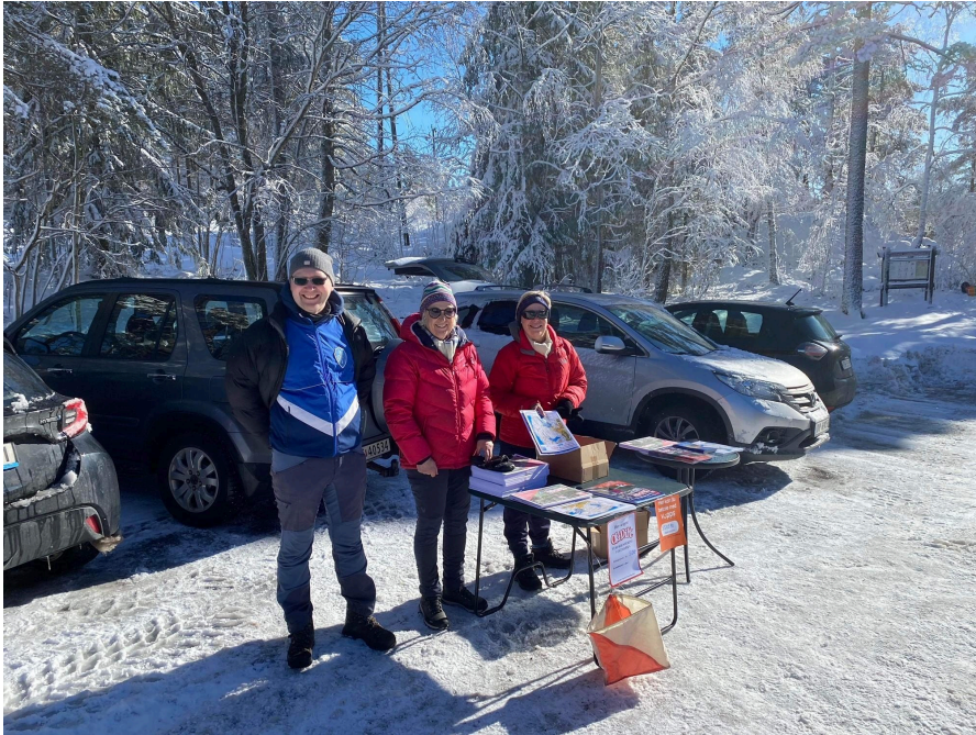
Fortsatt svært vinterlig på åpningsdagen i mars!