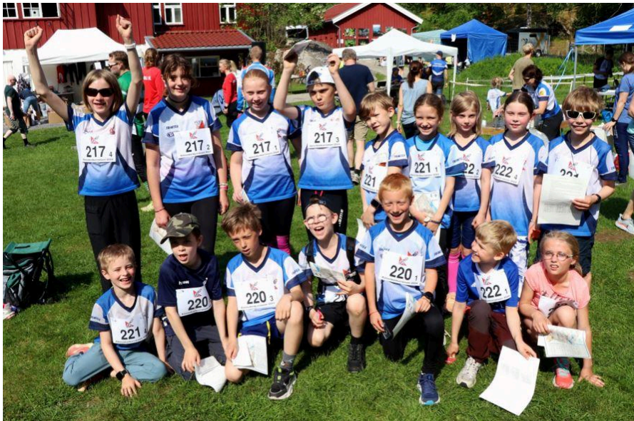
Oppsal-lagene i Råtasskonkurransen på Sandbakken

Oppsals råtasser startet 2024 sesongen den 7. mai på Haraløkka med mange nye rekrutter og gledelig nok mange der familien ikke tidligere har drevet med orientering. Tilstrømmingen fortsatte gjennom sesongen og totalt har vi hatt 46 forskjellige barn med på treningene med et gjennomsnitt på 30 stykker på hver. Råtasstreningene våre ble arrangert hver tirsdag helt frem til den åttende oktober.