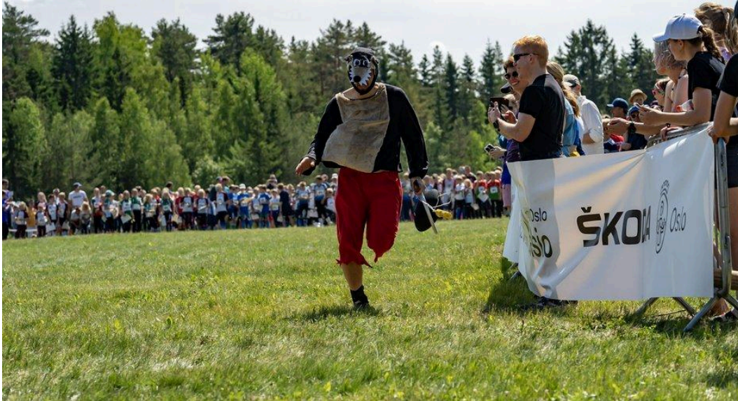
O-festivalen 2023 - en suksess på alle måter, ikke minst jakten på Østmarka-ulven!

Klubben søkte også flere ordninger om økonomiske bidrag og fikk god uttelling på dette. Klubben fikk mot slutten av året inn store refusjoner for kart brukt ifm. O-Festivalen.