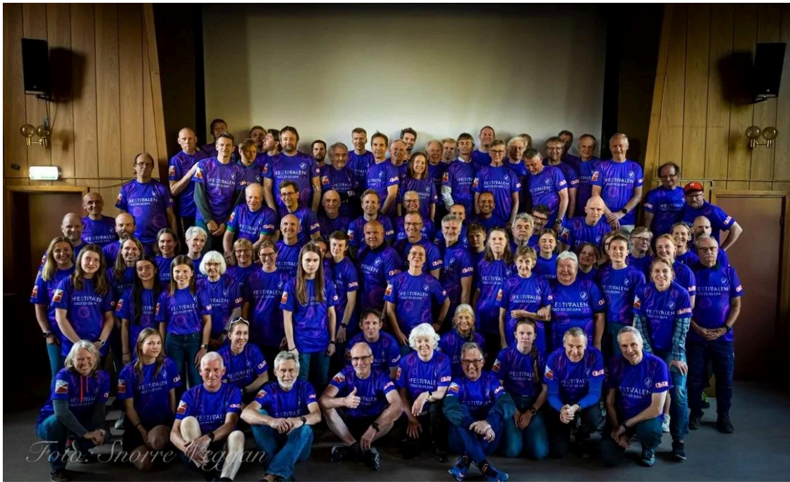
Dugnadsgjengen på kickoff 1.juni

Med dyktige klubbmedlemmer og selvgående bidragsytere gikk O-festivalhelgen som et velsmurt maskineri fra start til slutt. Takket være god planlegging og god dugnadsånd ble dette en vellykket helg - selv om det ble noe ekstra logistikk pga. sommervarmen.