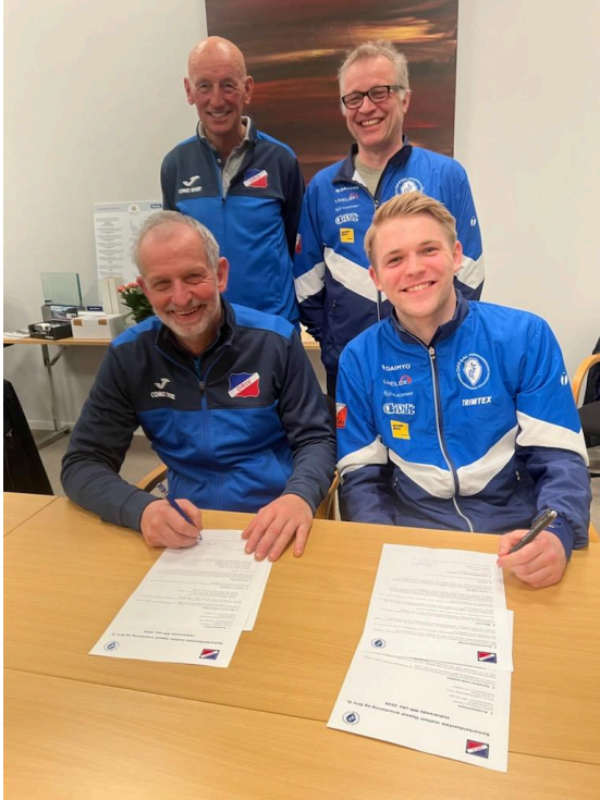
Samarbeidsavtale om NM og kart inngås med Driv IL

Det ble etablert en hovedkomite bestående av: