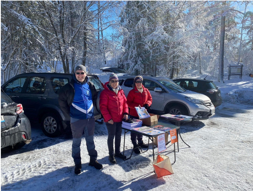
Fortsatt svært vinterlig på åpningsdagen i mars!