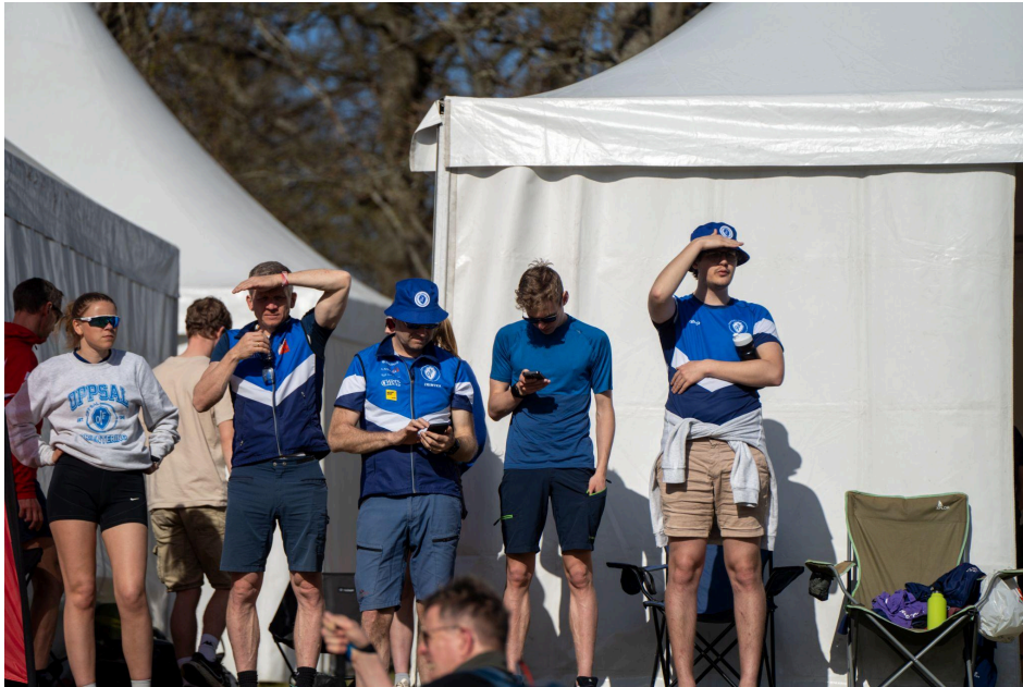
God stemning i supporterområdet gjennom alle tre stafettene

I ungdomskavlen var det mye god løping og alle Oppsals lag endte i øvre halvdel av resultatlista, med 79., 108. og 132. plass. Ungdommene skapte god stemning på arena med heining på samtlige av Oppsals løpere gjennom resten av dagen og natten.