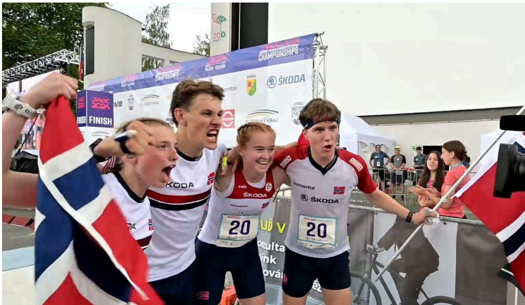
Norge slipper jubelen løs etter gull på sprintstafetten!

*lagene fikk ikke plassering i VM, da landet hadde lag høyere opp på lista