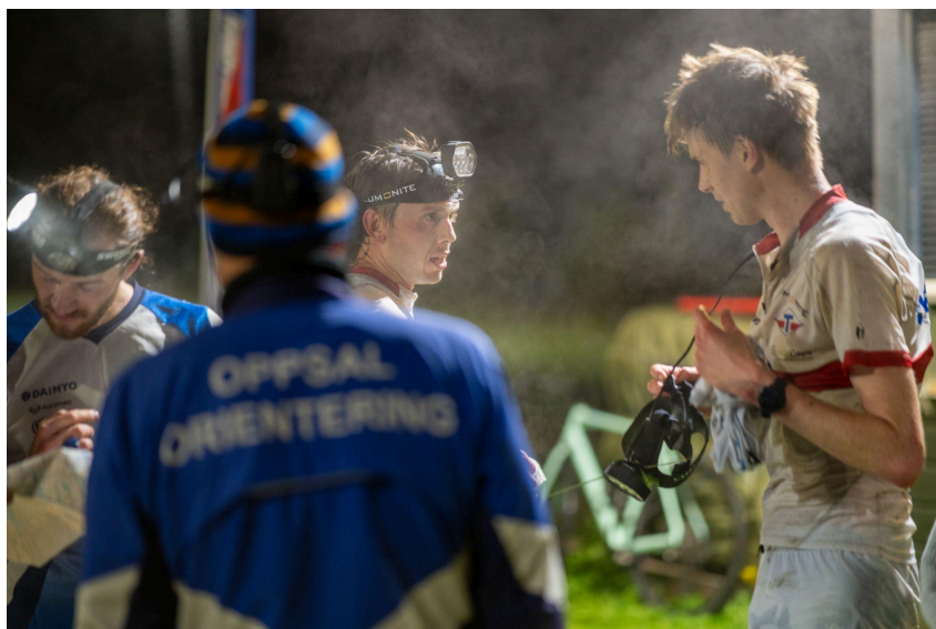
Fra nyvinningen "Nordisk mesterskap i nattorientering" på Skullerud. Sterk deltagelse, kjendis-løypelegger og meget god stemning