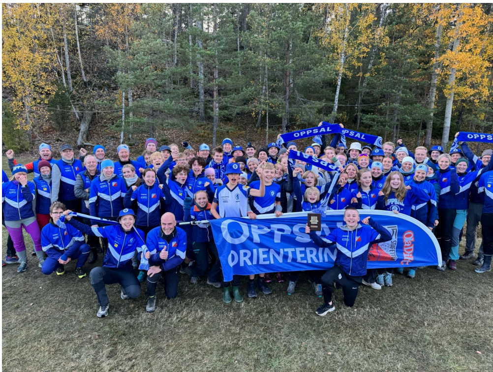
Oppsal-gjengen etter et av årets virkelige høydepunkter: 25.plass og klubbrekord på 25-manna!