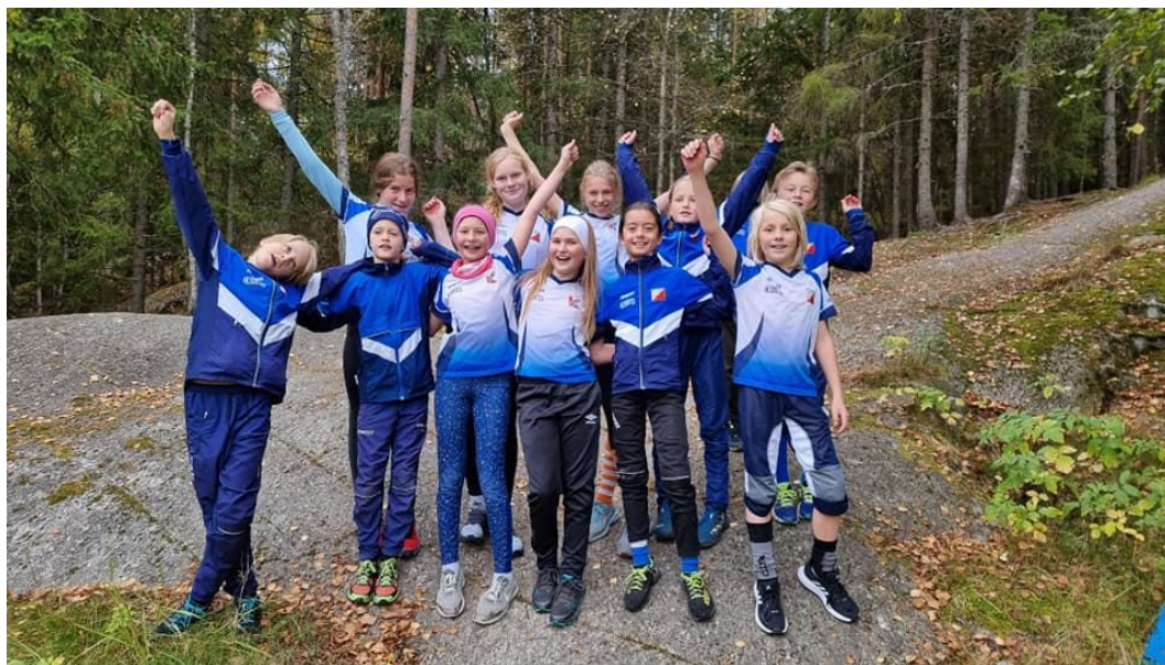
Tolv råtasser på o-trollsamling i september. Oppsal var største klubb!

Råtassene er o-gruppas treningsgruppe for barn i alderen 9 – 12 år. Gruppen trener hver tirsdag i sommerhalvåret fra ulike steder i og nær Østmarka. Treningene er todelt, med ulike oppvarmingsleker først fordelt på gruppene 9 – 10 år og 11 – 12 år. Etter oppvarming løper råtassene korte orienteringsløyper på sitt nivå, med eller uten skygge av voksne.