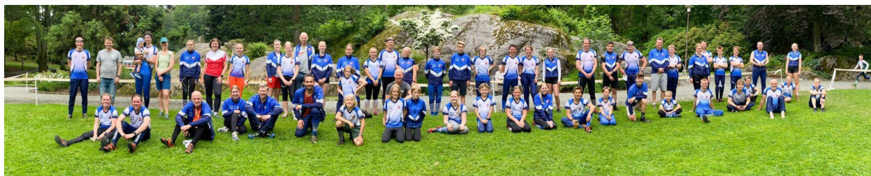
Oppsal-gjengen i full bredde siste dag av Sørlandsgaloppen. Over 70 medlemmer deltok på ferieløpene i Kristiansand og Mandal.

Sørlandsgaloppen 2021 i Mandal og Kristiansand med fire konkurranser på like mange dager seilte opp som det store sosiale høydepunktet i år. Mange familier var tidlig ute med å bestille overnatting på Åros feriesenter i Søgne og dermed ble det en stor Oppsal-base rett ved en av Sørlandets fine strender. Det var over 70 Oppsal-løpere som startet sommerferien sin med o-løp, sightseeing på Sørlandet og hyggelig sosialt samvær. Oppsal ble lagt merke til som en av de største klubbene under arrangementet, og med sportslige resultatene som sto i stil: Klubbens beste løpere kapret én klasseseier og to andreplasser i sammendraget.