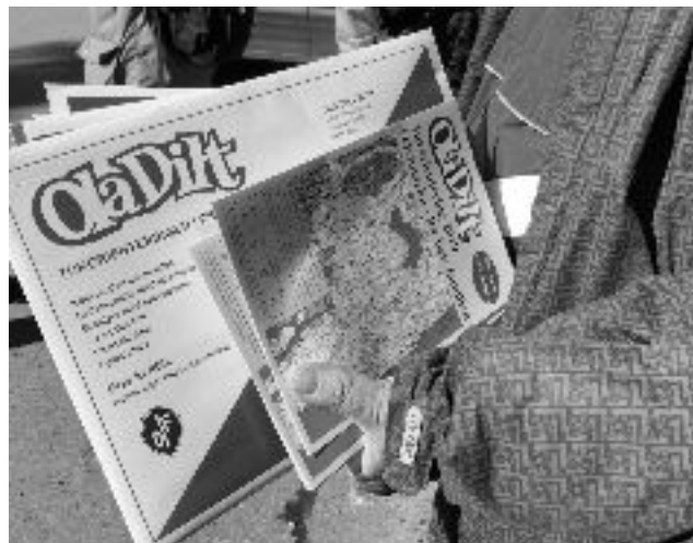
Fra åpningsdagen. Pølsegrill og salg av konvolutter.

Vi hadde Åpningsdag 31.mars med egne åpningsposter ved Ulsrudvann. Det var et godt oppmøte og til tross for noe snø, ble det salg av ca. 200 deltagerposer! Og Ola Dilt bidro med bål og pølser til grilling, samt kaffe og saft.